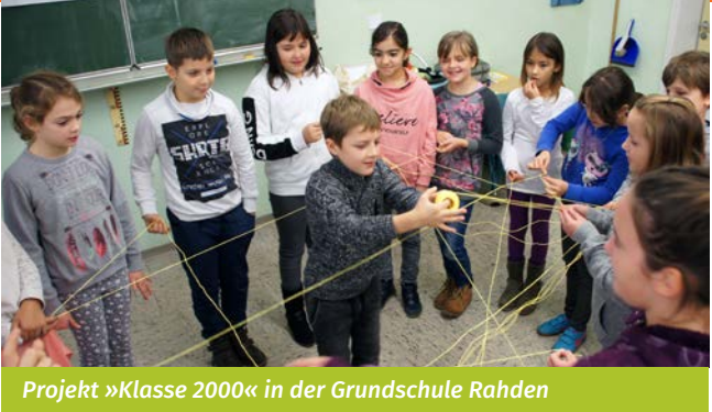
Projekt »Klasse 2000« in der Grundschule Rahden